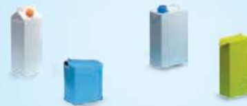
Lait, jus de fruits, crème fraîche, passata...