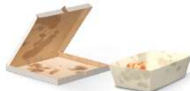
الورق والكرتون المتسخ أو الدهني