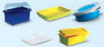
Trays, tubs and dishes/punnets