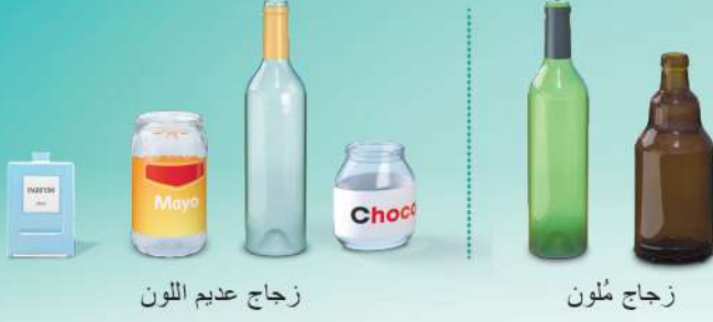
زجاج عديم اللون