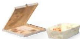
Papier et carton sale ou gras