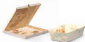
Vuil of vettig papier en karton