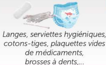
Langes, serviettes hygiéniques, cotons-tiges, plaquettes vides de médicaments, brosses à dents,...