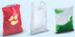
Zakken en zakjes