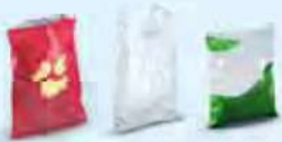
Beutel und Säcke