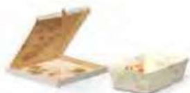
Verschmutztes oder fettiges Papier bzw. Karton