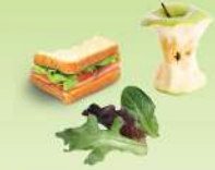
Restos de comida