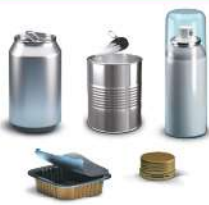
Embalagens de metal