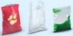
Sacos e saquetas