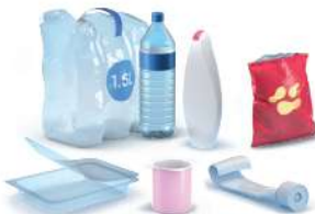
مواد التغليف البلاستيكية