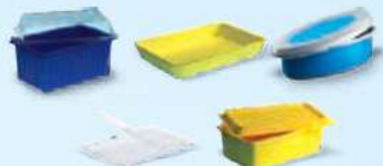
Barquettes et ravers