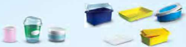
Schalen, Tiegel und Essensbehälter