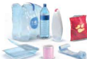
Emballages en plastique