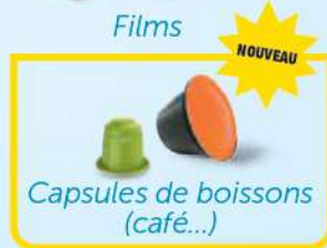
Capsules de boissons (café...)