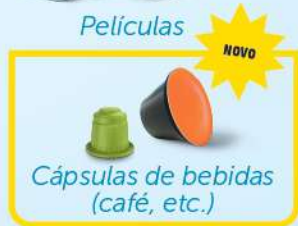
Cápsulas de bebidas (café, etc.)