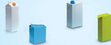
Leite, sumos de fruta, natas, passata...