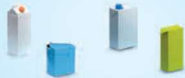
Milk, fruit juice, cream, tomato sauce...