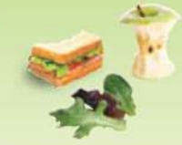
Restes de repas