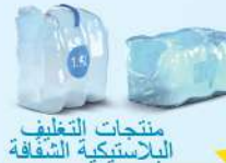
منتجات التغليف البلاستيكية الشفافة