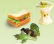
Reste von zubereiteten Mahlzeiten