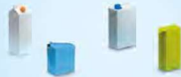
Milch, Fruchtsäfte, Sahne, Passata...