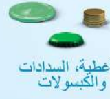
الأغطية، السدادات والكبسولات