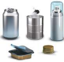
مواد التغليف المعدنية