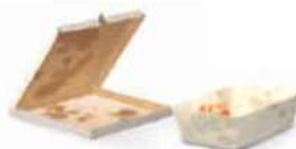
Dirty or greasy paper and cardboard