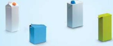
الحليب، عصير الثمار، الكريمة، المعجنات